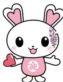
富士見市社協「うさみん」

注2:うさみんの色を変える、縦横比を変える、イラストそのものを変更することはできません。