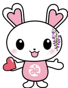
富士見市社会福祉協議会 マスコットキャラクター「うさみん」