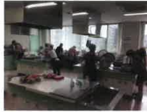
調理開始！ 野菜を洗って切る ところからスタートです