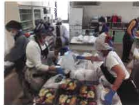
皆が持ち帰りやすいように。 手提げ袋にいれます