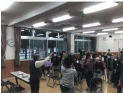
水谷東2丁目サロン