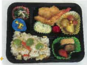
愛情たっぷり弁当が完成