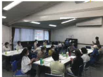
ふれあい健康づくりの集い