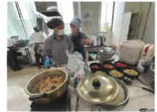
おいしくなあれ、おいしくなあれ。 大きなお鍋で煮ていきます