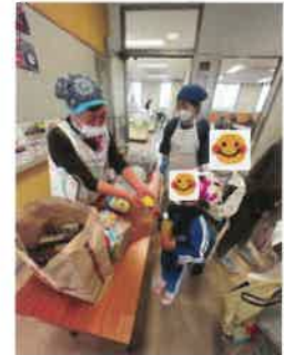
16:30 続々と笑顔の子どもたちがやってきます ボランティアさんにとって一番幸せな時間です