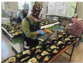
いよいよ容器に 詰めていきます