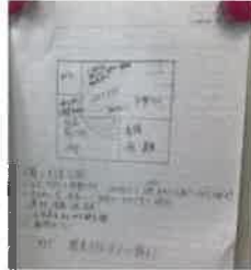
AM9:30 レシピを共有します