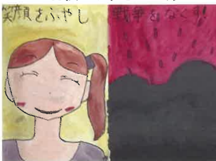
世界中から戦争をなくし笑顔ふやす