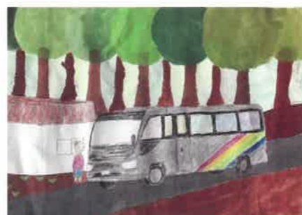
未来で活躍するバス