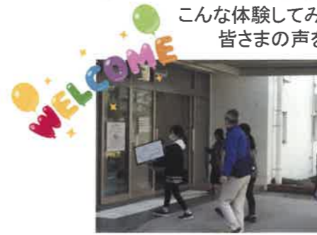
聴覚障がいの方をお出迎え 教室まで案内できるかな？

富士見市社会福祉協議会では市内小中学校からのご要望に沿った福祉教育学習を推進しています。 こんな体験してみたい！こんなボランティアしてみたい！ 皆さまの声をどしどしお寄せください！