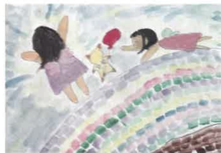
羽根とやわらかい床