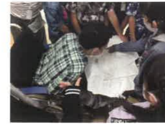
肢体不自由の方が書いた ノートに質問がたくさん！