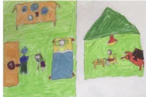
離れていても安心