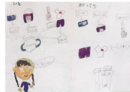
まほうのランドセル