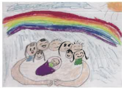
家族と、みんなで育てる