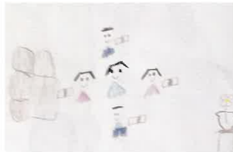
みんなと遊んであげる