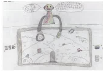
いろいろな家事ができるロボット