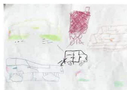
ガンバレ車の世紀