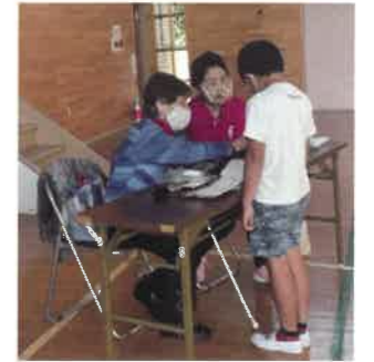
視覚障がい者のための便利グッズを体験