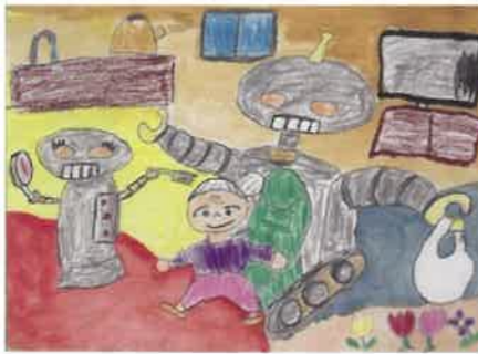
なんでもお手伝いするロボット