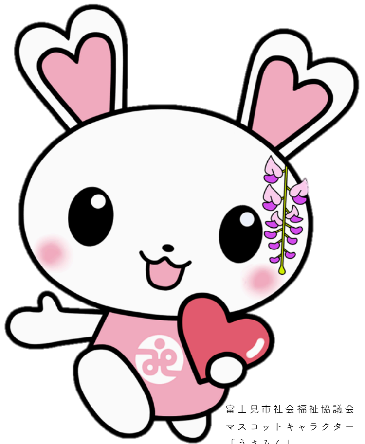
富士見市社会福祉協議会 マスコットキャラクター 「うさみん」